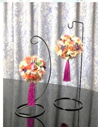
写真はイメージです 柄が変更になる場合があります ※吊りかけるスタンドは含まれません