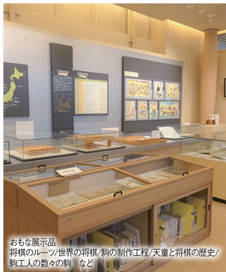
おもな展示品 将棋のルーツ/世界の将棋/駒の制作工程/天童と将棋の歴史/ 駒工人の数々の駒 など

天童市将棋資料館は将棋のまち天童のシンボルとして1992年にオープンしました。天童市の駒づくりは、江戸時代末期に天童織田藩の藩士の内職に始まったとされ、その後、昭和初期の戦時中に戦地への「慰問品」としての駒作りが盛んになりました。今では天童市の将棋駒生産量は、国内の将棋駒生産量の多くを占めています。