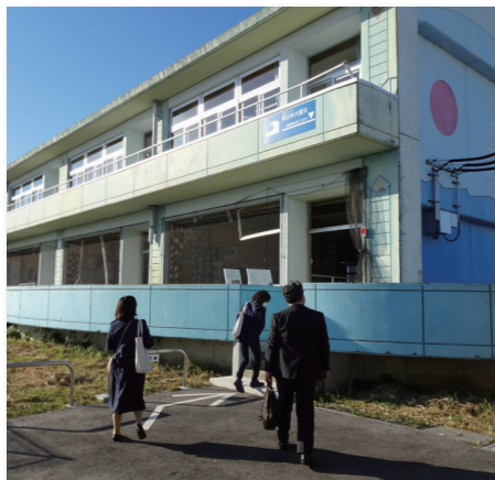
震災遺構 請戸小学校