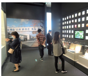
東日本大震災・原子力災害伝承館

10月29日(土)に(一社)東北圏地域づくりコンソーシアムの主催により合同視察会が開催され、北海道・東北各地の避難者支援団体が、川俣町・浪江町・双葉町を訪れました。仙台駅に集合し、東北中央自動車道を経由して川俣町へ。山木屋地区にある復興拠点商業施設「とんやの郷」にて特産品のアンスリウムなどを見学。その後、いまだ帰還困難区域が続いている津島地区を経由して浪江町に入り、「震災遺構 請戸小学校」や双葉町の「東日本大震災・原子力災害伝承館」を訪れました。途中「道の駅なみえ」に立ち寄りましたが、週末ということもあり多くの観光客で賑わっていました。伝承館では語り部の講話をお聞きました。南相馬市から山形県へ母子避難をされた方で、ありのままの迫真の体験談が心に残りました。