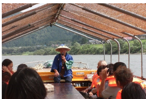
船頭さんの軽快なトークに大盛り上がり

9月4日(木)に、新庄市の先にある戸沢村古口から乗船する、最上川舟下りに行ってきました。寒河江市社会福祉協議会の主催で、2才から80代まで16名の皆さんと社協のバスに乗り込み、果樹畑やそば畑を眺めながら胸を躍らせ和気あいあいで行きました。まだ紅葉はしていませんが、濃緑の木々や雄大な最上川、爽やかな秋空のコントラストがすばらしかったです。風がありましたかと思っていたより揺れず、船頭さんの舟唄と最上なまりの語りを楽しみながら、船上でいただく弁当に舌鼓し、ゆったりとした時が流れました。