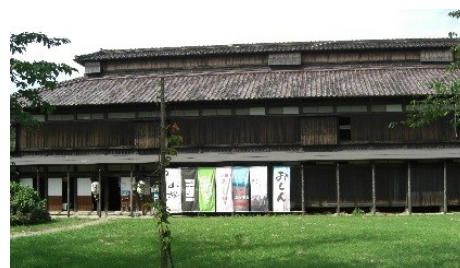
庄内映画村資料館