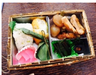
山形の郷土料理弁当

9月4日(木)に、新庄市の先にある戸沢村古口から乗船する、最上川舟下りに行ってきました。寒河江市社会福祉協議会の主催で、2才から80代まで16名の皆さんと社協のバスに乗り込み、果樹畑やそば畑を眺めながら胸を躍らせ和気あいあいで行きました。まだ紅葉はしていませんが、濃緑の木々や雄大な最上川、爽やかな秋空のコントラストがすばらしかったです。風がありましたかと思っていたより揺れず、船頭さんの舟唄と最上なまりの語りを楽しみながら、船上でいただく弁当に舌鼓し、ゆったりとした時が流れました。