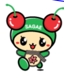
寒河江市イメージ キャラクター チェリン