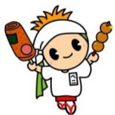
はながたベニちゃん