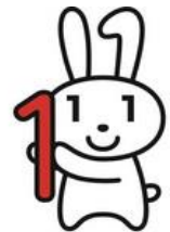
マイナンバーキャラクター マイナちゃん

コールセンター・全国共通ナビダイヤル ☎0570-20-0178 もしくは、住民票のある市区町村へお問い合わせください。