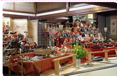
旧風間家住宅「丙申堂」

鶴岡市内旧家に伝わる江戸時代から昭和初期までの享保雛や古今雛など数百体のお雛様と雛道具を展示。鶴岡ならではの「ちょんびなさま」をあしらった城下町の雅な雛祭りを再現した豪華な8段飾りが圧巻。 9:30～16:30※期間中は無休