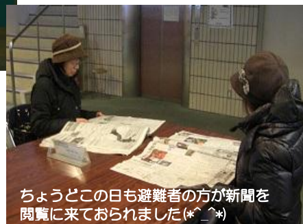
ちょうどこの日も避難者の方が新聞を閲覧に来ておられました(*^_^*)

温海分館(温海庁舎となり温海ふれあいセンター内)で福島民友新聞を閲覧できます(^_^)v 開館時間は 9:00～17:00 で、年末年始以外は毎日利用できます！(日)(祝)も OK です！