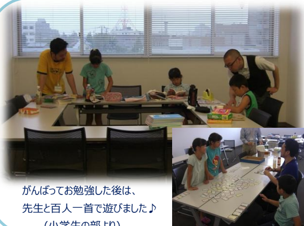
がんばってお勉強した後は、先生と百人一首で遊びました♪ (小学生の部より)

夏休みを利用した学習支援企画として、7月27日(土)、28日(日)、8月3日(土)、4日(日)の4日間、「週末寺子屋 in 鶴岡」が開催されました! 小学校4年生~高校生がいる避難者世帯に直接ご案内したところ、宮城県・福島県の世帯から小学生~高校生まで7名の方にお申込みいただきました。主催の子ども支援フェイスブックプロジェクトは山形市や米沢市で学習支援を実施しており、今年度初の庄内出張となりました。