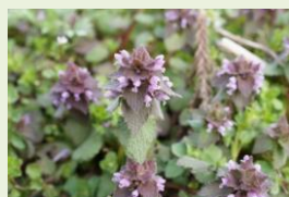
ヒメオドリコソウ