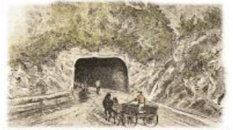
栗子山隧道米沢側

昭和41年国道13号開通 自動車交通に対応するためのルート見直し。 現在の西栗子トンネル(2,675m)、東栗子トンネル(2,376m)による国道の完成です。