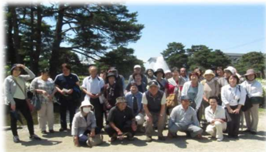
楽しみにしていた白つつじ。 残念ながら見頃が過ぎてしまいました。