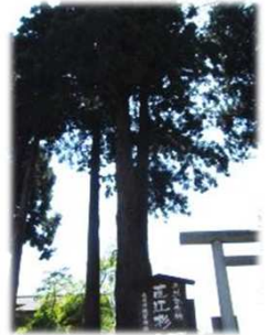
直江兼続がお手植えしたといわれる直江杉。 とてもどっしり、りっぱでした。