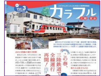
カラフル三陸・宮古

※当センターに復興情報誌「カラフル三陸・宮古」が届いています。お持ち帰りいただけますので、どうぞご利用ください。