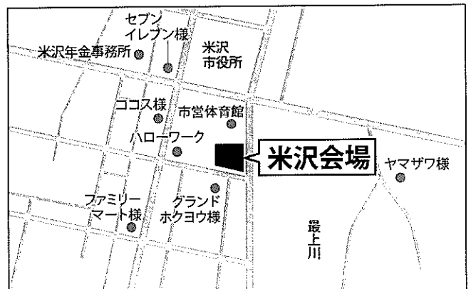
〈米沢会場〉置賜総合文化センター 301研修室 (米沢市金池3-1-14) 〈申込締切〉平成30年1月19日(金)