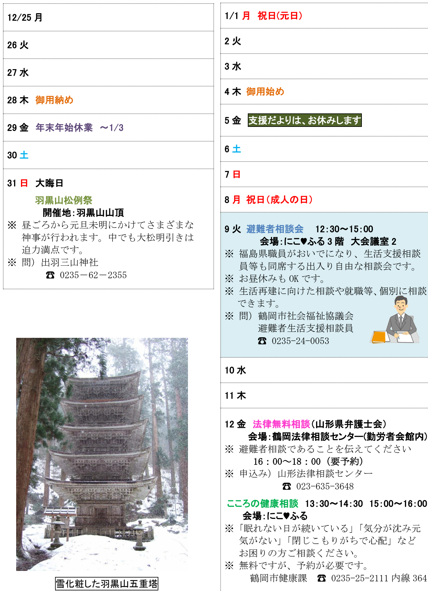
雪化粧した羽黒山五重塔