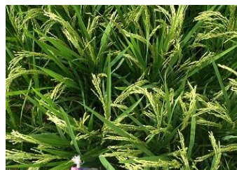
8月20日出穂・穂揃い