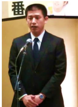
浪江町本間副町長