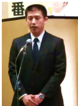
浪江町本間副町長