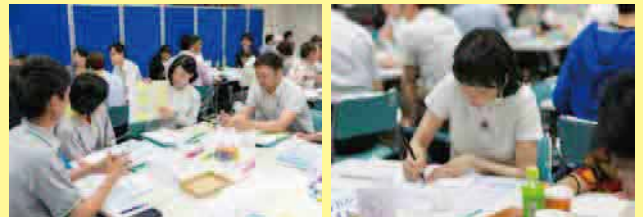
組織の課題を深掘りしながら、課題の根本を捉えるワークを行います。