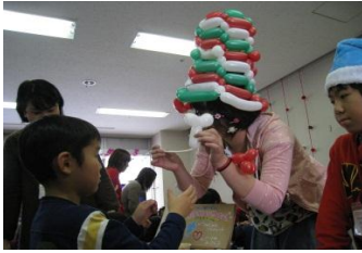
バルーンピエロ☆ましゅまろちゃん

12月15日「だがしや楽校」にて、クリスマスパーティーが行われました。突然の雪景色にも負けず、82名の親子と13名のボランティアスタッフが参加。もの作り屋台では、世界にひとつの作品がたくさん生まれました。また、これまでのだがしや楽校関連作品が当たる抽選会では、講師スタッフ渾身の作品に歓声上がる場面も。「アレ作ってみたい！」と思われた方、今後の「だがしや楽校」「大人のだがしや楽校」にご期待ください☆