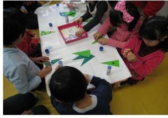
お願いサンタさん！おねだり短冊