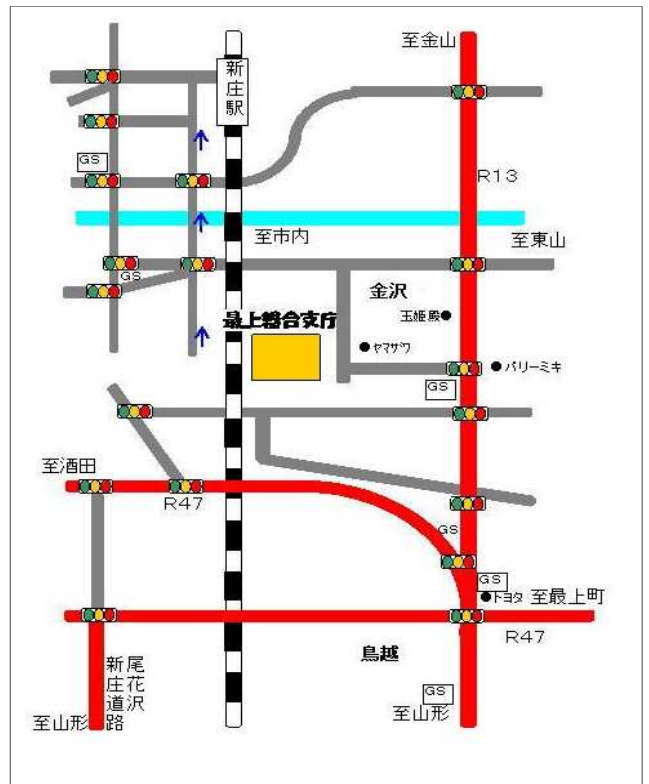
山形県最上総合支庁の地図(ホームページより転載)

山形財務事務所「借金に関する相談窓口」 023-641-5201へお気軽にお電話下さい。